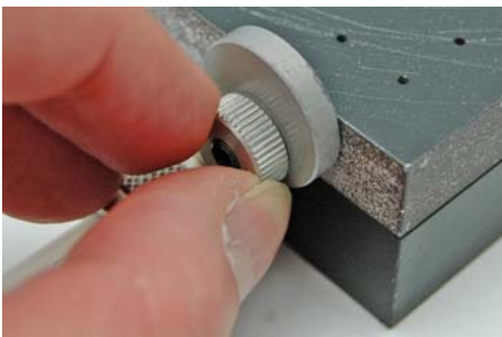
Abb. 4: Anschlagsscheibe festziehen