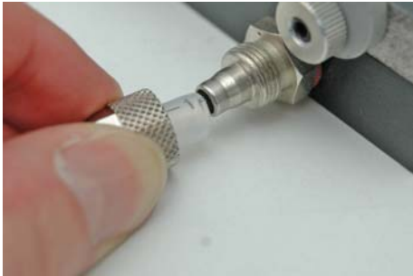
Abb. 2: Vakuumschlauch anschließen