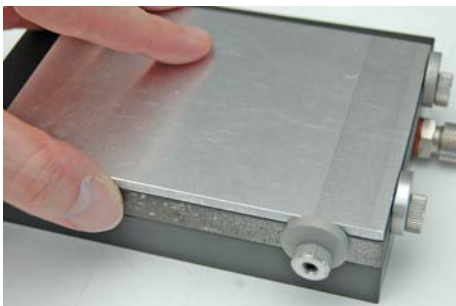
Abb. 5: Werkstück spannen