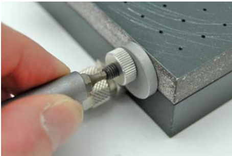
Abb. 3: Gewindestift einschrauben

Sind dagegen die zu bearbeitenden Werkstücke größer als die Spannfläche der Vakuum-Spannvorrichtung, dürfen die Anschlagsscheiben nicht über die Kante der Vakuum-Spannvorrichtung herausragen.